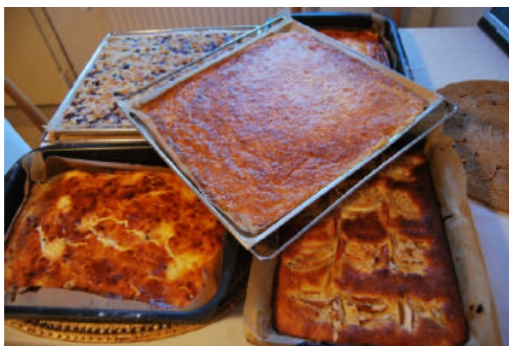
Mein Kuchen für Euch ging weg – vollkommen.