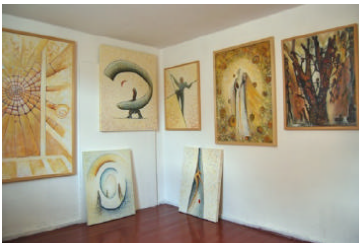
Zum Bilderspeicher unterm Dach.